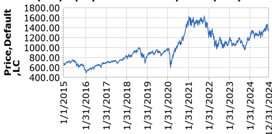
— UBS (Lux) Equity Fund - Small Caps USA (USD) P-acc