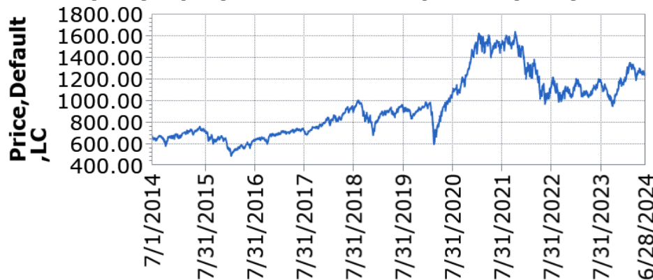
— UBS (Lux) Equity Fund - Small Caps USA (USD) P-acc