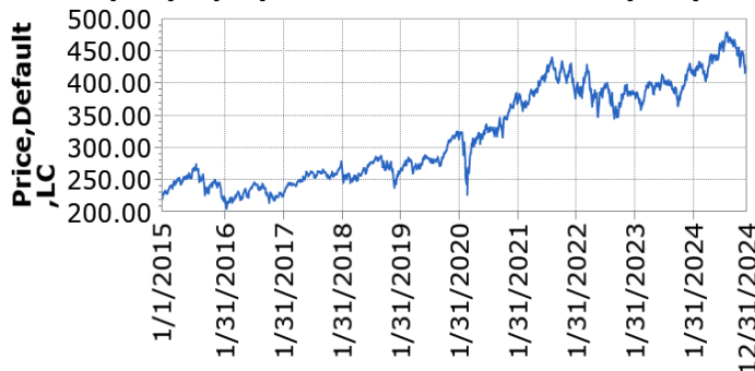
— UBS (Lux) Equity Fund - Sust Health Trans (USD) Pa