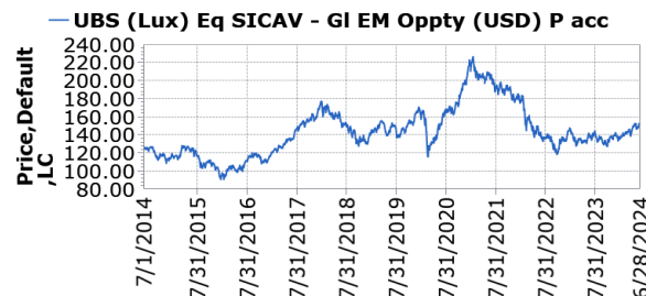
Time period 7/1/2014 To 6/30/2024