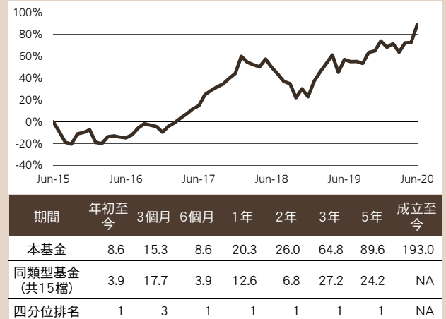
圖 1：本基金短中長期績效

基金轉型日為 2010 年 7 月 16 日，成立至今起算日為 2010 年 7 月 19 日