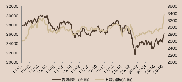
圖 2：上證指數 vs. 恒生指數走勢