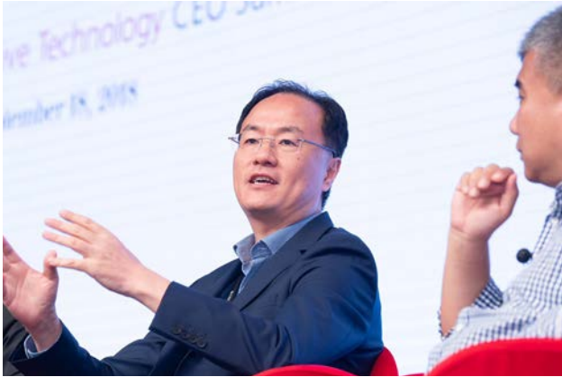
全明星投資基金共同創辦人 季衛東博士