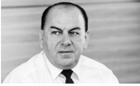
6.1.1. Axel A. Weber als Verwaltungsratspräsident