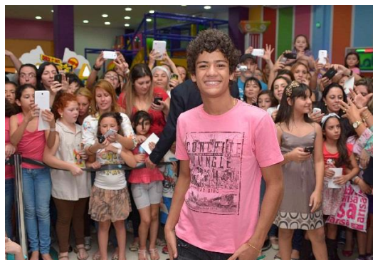
Tarde de autógrafos - setembro/14