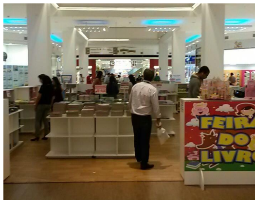
Feira do livro - setembro/14