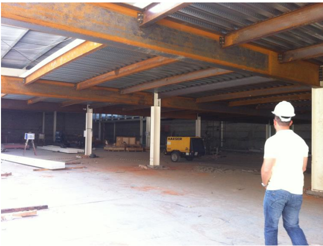
Estrutura da expansão – outubro/14

A previsão de entrega do espaço para a PRODESP, responsável pela operação do Poupatempo, é no encerramento de outubro de 2014. A estimativa mais recente é de que o Poupatempo esteja em operação até março de 2015.