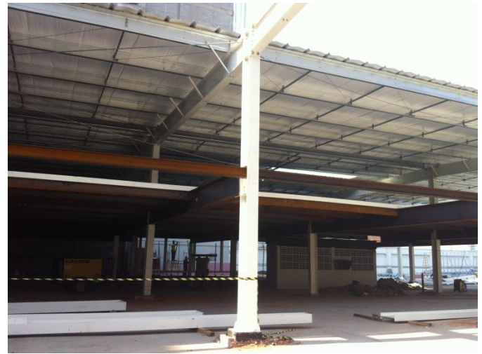
Estrutura da expansão – outubro/14