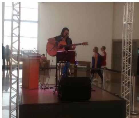
Domingo musical - setembro/14