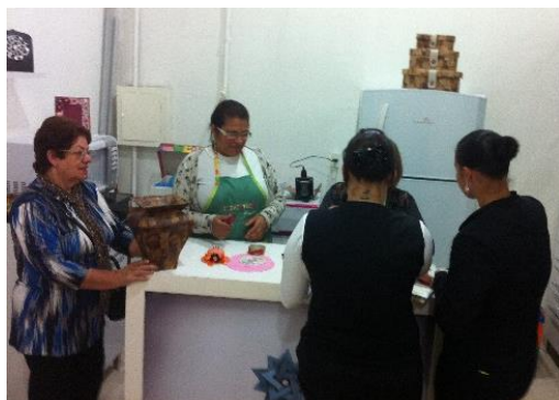
Cursos gratuitos no Espaço Atrium - setembro/14