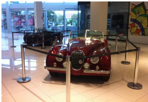
Exposição de carros antigos – agosto/14