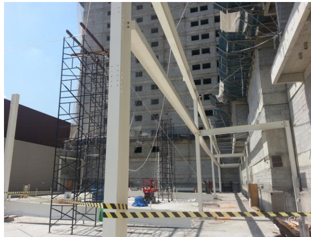
Montagem da estrutura metálica – setembro/14