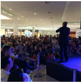
Show de mágica - julho/14