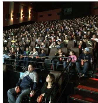
Pré estreia no cinema - agosto/14