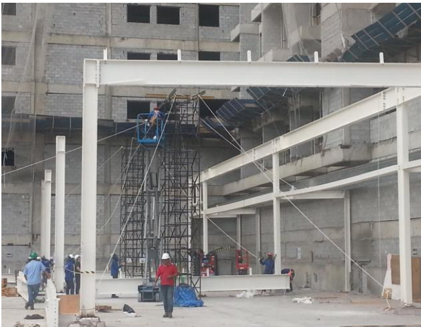
Montagem da estrutura metálica – setembro/14

A dissolução da SPE foi assinada em 1º de setembro, passando o Fundo a assumir diretamente, a partir de então, todos os direitos e obrigações, incluindo as receitas geradas pelo empreendimento (isentas de tributação conforme a legislação vigente para fundos de investimento imobiliário, agora que o Fundo possui a propriedade direta do imóvel).