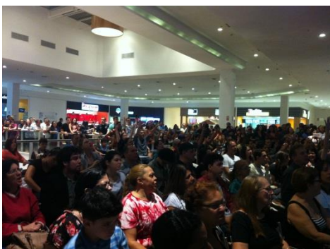
Show na praça de alimentação – agosto/14