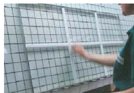
Fabrication d'un vitrage avec croisillons intégrés