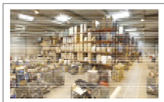
Gestion informatisée des flux logistiques