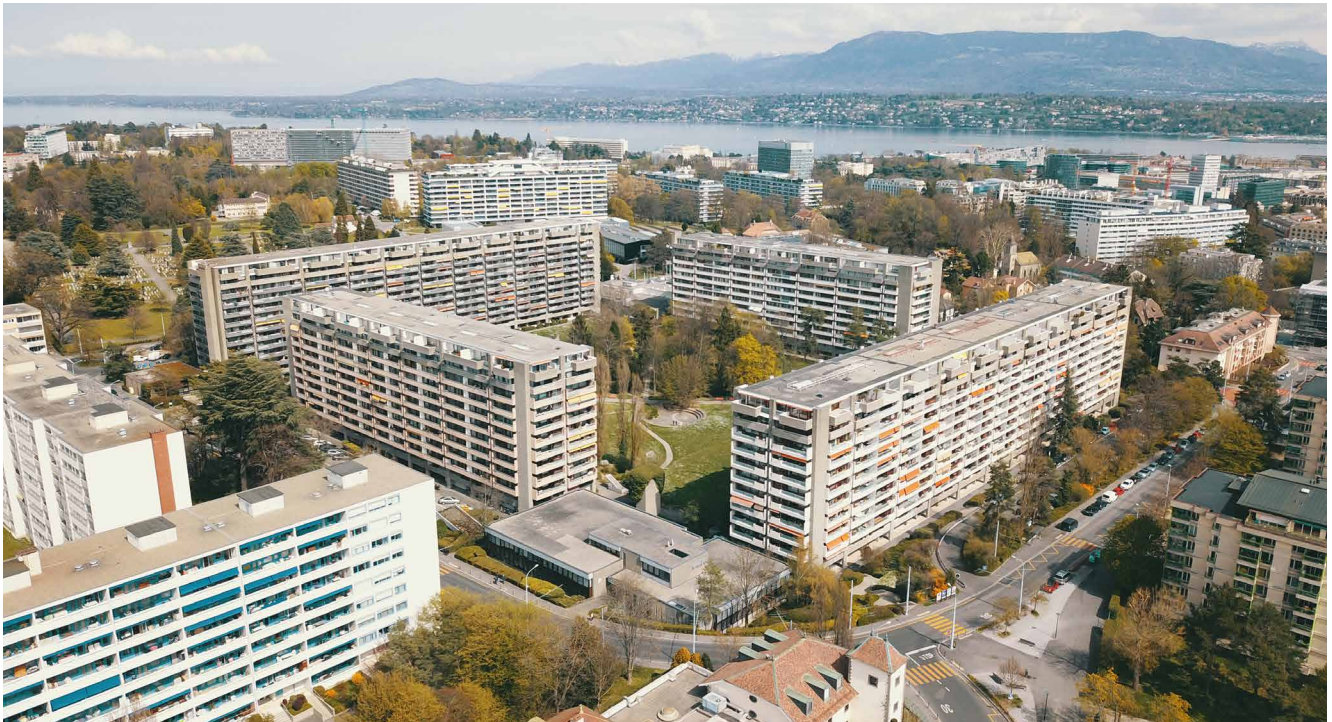
Quartier « La Tourelle » in Genf