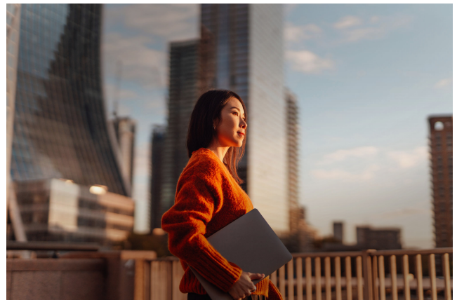
UBS, a mayo de 2025.

La inteligencia artificial está generando aumentos de productividad para los trabajadores del conocimiento —profesionales que aplican conocimientos teóricos y analíticos adquiridos mediante formación formal para desarrollar productos y servicios— en todo el mundo. Se espera que su impacto supere incluso al de internet y genere grandes oportunidades de inversión y beneficios empresariales en las próximas décadas. Esta tendencia está impulsando una inversión de capital considerable en infraestructura de IA —especialmente en centros de datos— respaldada por avances constantes en los modelos y una fuerte monetización en diversos sectores, aunque todavía se halla en una etapa incipiente. Consideramos que el mayor