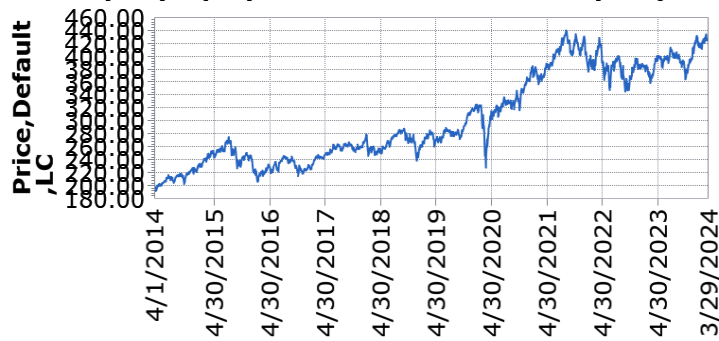
— UBS (Lux) Equity Fund - Sust Health Trans (USD) Pa